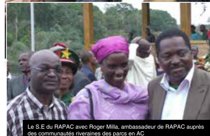
Le S.E du RAPAC avec Roger Milla, ambassadeur de RAPAC auprès des communautés riveraines des parcs en AC