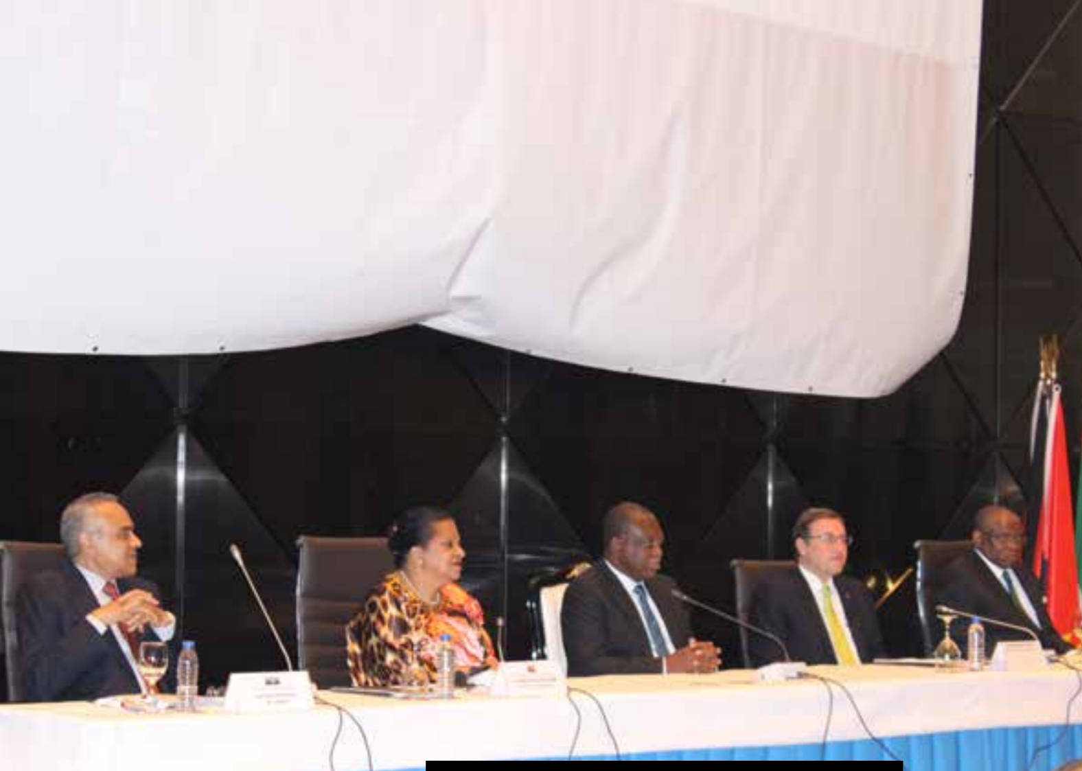
Présidium ouverture solennelle de la célébration de la journée mondiale de l'environnement en Angola

les résolutions adoptées lors de l'Assemblée des Nations pour l'Environnement portant notamment sur l'éradication du crime sur les espèces sauvages et la mobilisation internationale des ressources financières et technologiques en vue de réduire considérablement l'ampleur du phénomène. L'Angola possède de magnifiques ressources environnementales comme un littoral encore vierge ainsi que des forêts et des prairies comparables à celles de la Namibie ou de la Zambie. Dans le pays vivent des lions, des grands singes et des antilopes géantes, des perroquets gris d'Afrique dont le déclin est dû essentiellement au commerce illicite.