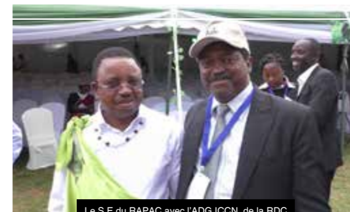
Le S.E du RAPAC avec l'ADG ICCN de la RDC

Dans le même temps, la réforme s'attaque aussi à la gouvernance institutionnelle, administrative et financière du RAPAC en tant que structure organisationnelle. Nous devons être capable de rassurer tous nos partenaires et mener avec eux des programmes et projets permettant de consolider les aires protégées et le réseau.