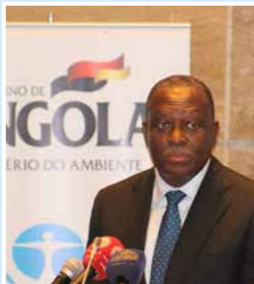
S.E Manuel Vicente, Vice-Président de l'Angola

« En décembre 2015 à Paris, le monde aura rendez-vous avec l'avenir de la planète. Nous accueillerons en effet ce qui s'appelle la Conférence des Nations Unies sur le Climat, c'est-à-dire la COP21. L'objectif est simple, il s'agit d'aboutir à un accord mondial afin que notre planète reste vivable. Nous savons que si nous n'agissons pas maintenant, ce qui nous menace c'est un dérèglement climatique catastrophique avec des conséquences dans tous les domaines. Notre responsabilité est donc historique puisque nous sommes la première génération à, à la fois, prendre vraiment conscience du problème, mais nous sommes la dernière génération à pouvoir agir. Mon rôle en tant que président de cette conférence au nom de la France, ce sera d'écouter chacun et de promouvoir une vision partagée par tous les pays pour arriver à un Le vice-président angolais Manuel Vicente représentant le Président angolais José Eduardo dos Santos a déclaré lors de la célébration de la Journée mondiale de l'environnement le 5 juin dernier, que son gouvernement a toujours pris des mesures concrètes pour préserver la biodiversité. Au cours des dernières années, la superficie des parcs et réserves naturels a été doublée