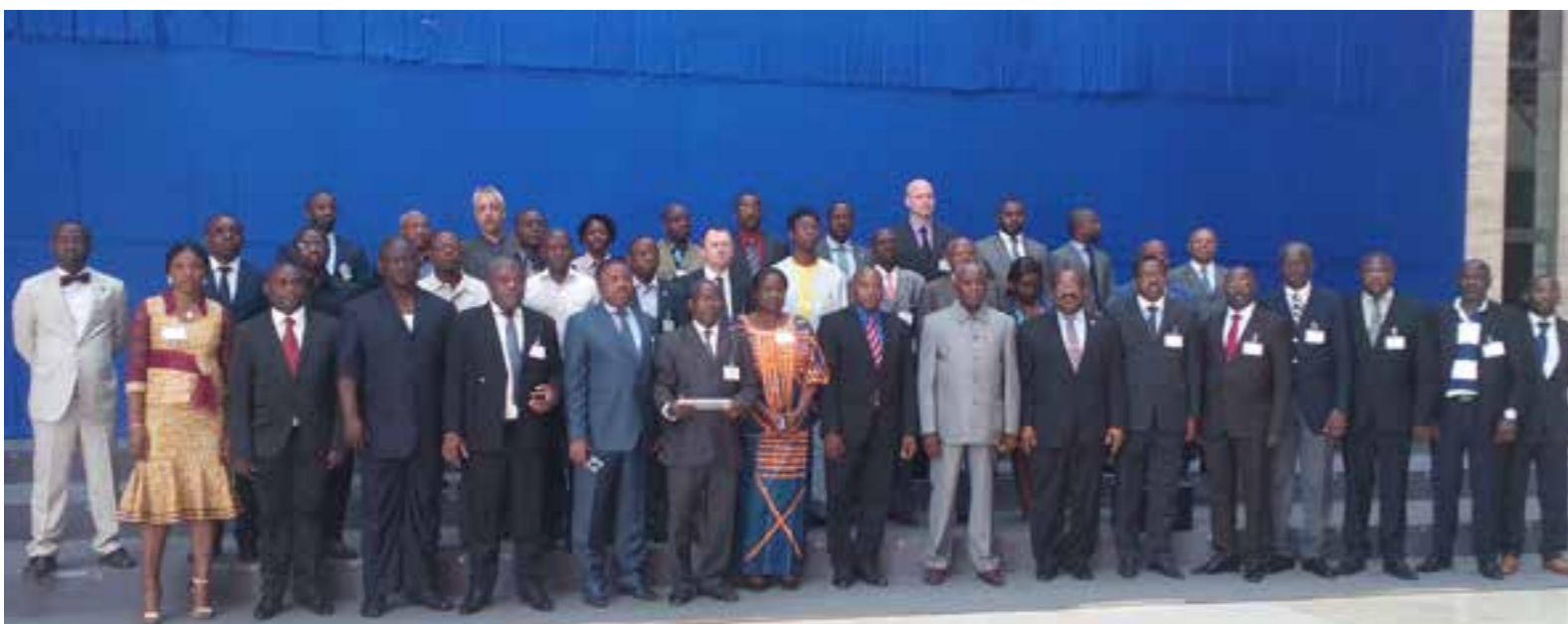
Photos de Groupe du Conseil d'Administration du RAPAC à Malabo en Février 2016

« Le RAPAC a toujours été et reste une organisation technique, associative, un RESEAU qui permet aux acteurs d'échanger sur les meilleurs moyens de conserver et de valoriser les aires protégées. »