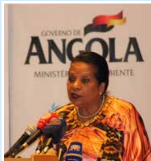
Dr. Fatima Jardim, Ministre de l'Environnement de l'Angola

Il a aussi appelé au renforcement de la coopération régionale et à une perspective mondiale pour lutter contre les actes criminels portant atteinte à la vie sauvage, alors que le monde entier est confronté à de sérieux défis dans la préservation du patrimoine naturel et de la biodiversité, gravement affectés par le braconnage et le commerce illégal d'animaux sauvages. ■