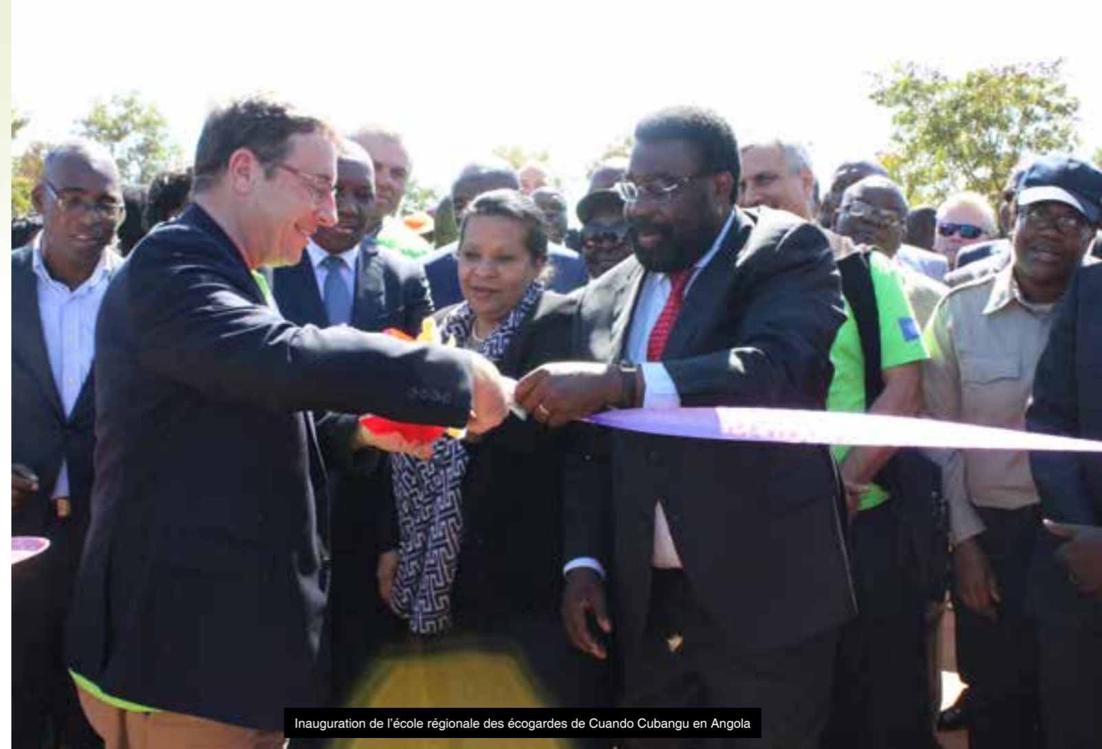
Inauguration de l'école régionale des écogardes de Cuando Cubangu en Angola

( hakuzadamas@gmail.com / +241 04045110)