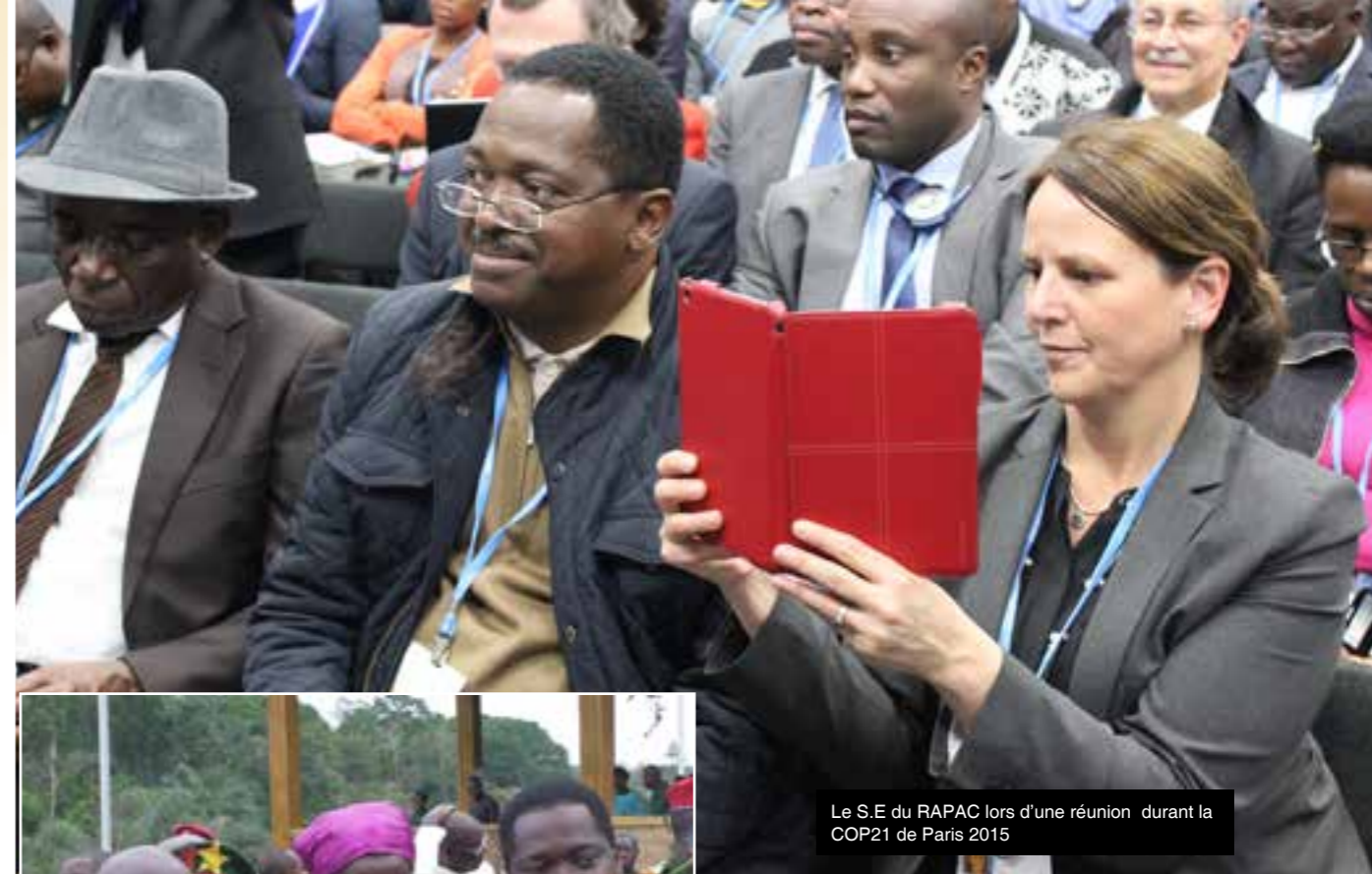
Le S.E du RAPAC lors d'une réunion durant la COP21 de Paris 2015