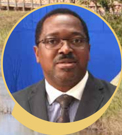
Mr Omer NTOUGOU NDOUTOUME Secrétaire Exécutif du Le Réseau des Aires Protégées d'Afrique Centrale (RAPAC)